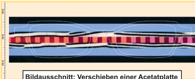
Bildausschnitt: Verschieben einer Acetatplatte

** nur geeignete Acetatplatten können verschoben werden