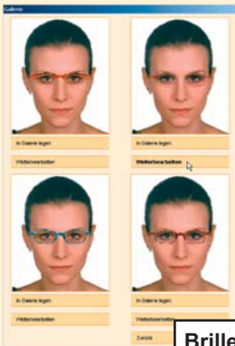
Brillenvergleich in der Galerie

Indual erleichtert Ihnen die Entscheidung: Nutzen Sie die Galerie, um die verschiedenen Brillenvarianten miteinander zu vergleichen. Die Brillen- bzw. Kundendaten können Sie per Internet an den Service-Partner* senden. Damit haben Sie alle Voraussetzungen für die schnelle Fertigung Ihrer virtuell designten Brillen.