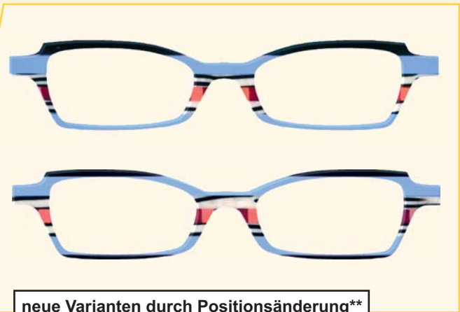
neue Varianten durch Positionsänderung**